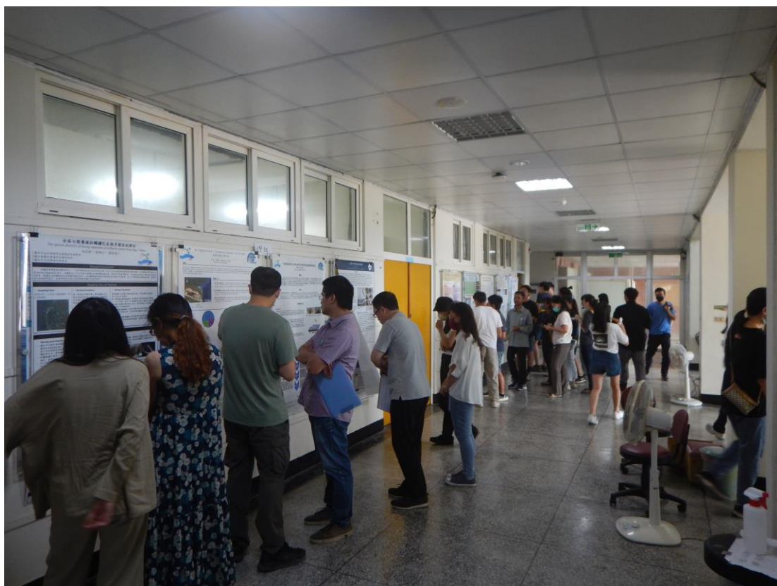
學生老師們仔細端詳每位參賽者之研究成果海報