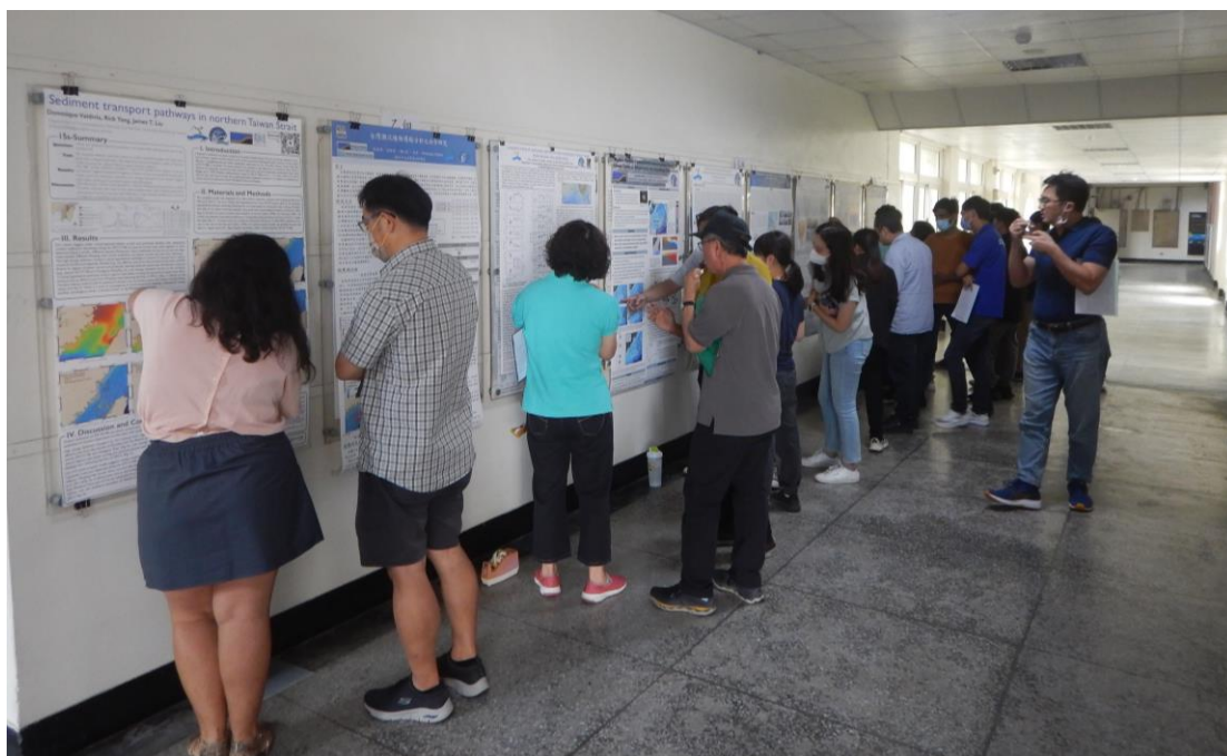
參賽者向聽眾解說研究成果